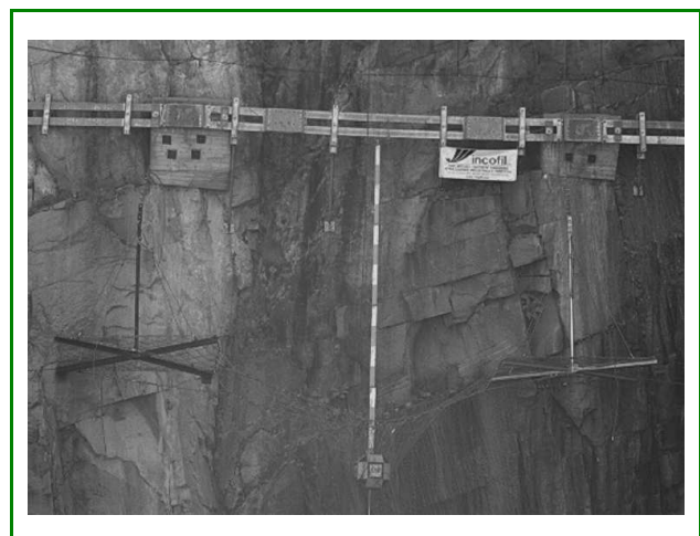
Barriera Testata mod. RAV_T Energia 50 kJ + 200 kJ + 200 kJ