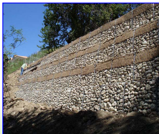
Foto 2 – La foto mostra le ultime fasi di costruzione del muro di sostegno in Gabbioni Verdi e riempimento delle tasche vegetative