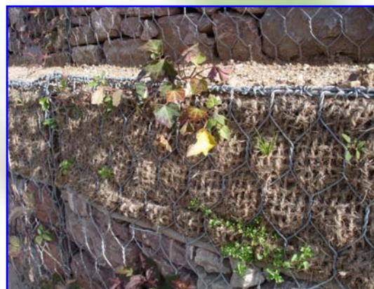
Foto – Le fotografie illustrano un intervento di consolidamento idrogeologico e sostegno realizzato con Gabbioni Rinverdibili. L'intervento si colloca nell'ambito della realizzazione e completamento della Pista Ciclo-Pedonale Circumlacuale del Lago di Molveno situato nel Parco Naturale Adamello Brenta (TN).