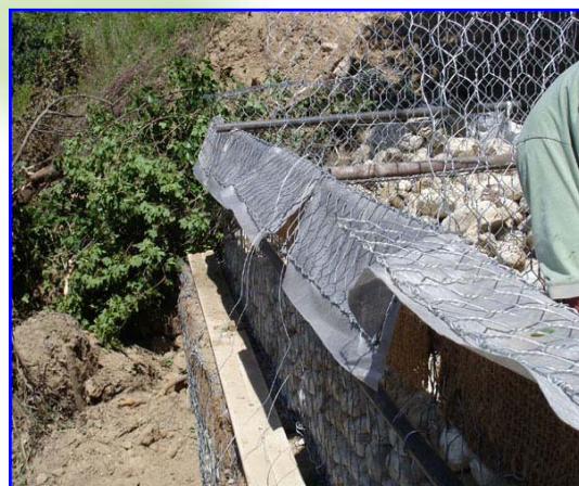
Foto 3 – Il dettaglio permette di apprezzare il posizionamento delle tasche vegetative chiuse, prima della messa in forma, legatura e riempimento con terreno vegetale